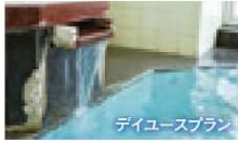
ディユースプラン